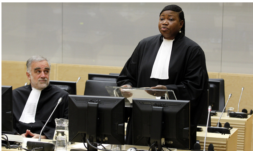
Passage de témoin à la CPI: Fatou Bensouda (Gambie) a remplacé Luis Moreno Ocampo (Argentine) au poste de Procureur général le 15 juin 2012.

Après dix ans d'activité, la Cour pénale internationale (CPI) s'est imposée comme une valeur sûre dans la justice pénale internationale. Mais des défis structurels, juridiques et politiques persistent: l'affiliation incomplète est problématique, la concentration sur l'Afrique suscite les critiques et le rapport entre justice et paix présente des tensions. La CPI exerce aussi un effet préventif malgré ces difficultés.