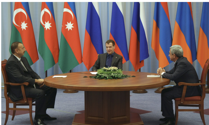
La Russie en tant que médiateur mitigé: Dmitri Medvedev et les présidents azerbaïdjanais et arménien, Ilham Aliyev (g.) et Serge Sargsian (d.). Astrakhan, le 27.10.2010.

Aucune solution politique n'est en vue dans le conflit du Haut-Karabagh entre l'Arménie et l'Azerbaïdjan malgré de longues années de tentatives de médiation internationale. Les parties au conflit se servent surtout des négociations pour maintenir le statu quo, fragile et insatisfaisant à long terme, et temporiser. Les acteurs externes n'ont pas la volonté ou l'influence nécessaire pour percer le blocus politique. Cette constellation empêche de façon durable le règlement du conflit.