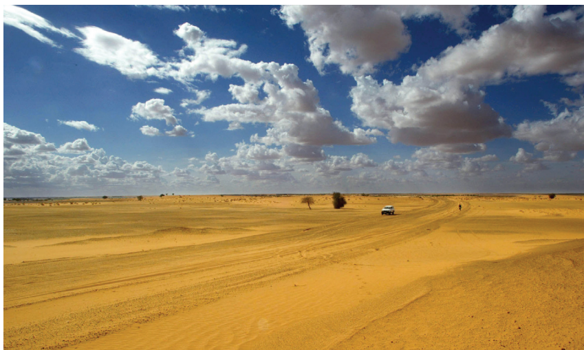
Touristes sur le bord du désert du Sahara au nord du Mali Forgo.

Ces dernières années, on peut observer une recrudescence des enlèvements avec demande de rançon partout dans le monde. Le kidnapping est devenu une source de revenu lucrative pour les groupes terroristes islamistes. La Suisse est au premier plan de la coopération visant à imposer à l'échelle mondiale un code de conduite uniforme dans la gestion des enlèvements contre rançon. L'enlèvement contre rançon sera aussi un thème en 2014, année de la présidence suisse de l'OSCE.