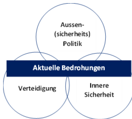
Figur 2: Einbettung der Kooperationsmöglichkeiten in eine umfassende und vernetzte Sicherheitspolitik

Die Einbettung und Steuerung der erweiterten Kooperationsmöglichkeiten sind eine Aufgabe der Sicherheitspolitik, die über die Sicherheitspolitischen Berichte gesteuert wird. Eine übergeordnete Gesamtsicht ist allein schon daher entscheidend, weil die bilaterale und die multilaterale Kooperation in der Praxis ineinander übergehen (siehe Empfehlung 5). Während die Impulse für gemeinsame Aktivitäten im Bereich der bilateralen Kooperation oftmals von unten (Fachebene) nach oben (sicherheitspolitische Ebene) fließen, müssen die Kooperationsimpulse im multilateralen Bereich primär von der strategisch-politischen Ebene kommen. Von besonderer Bedeutung sind dabei die Festlegung der übergeordneten inhaltlichen Schwerpunkte sowie die Steuerung der internationalen Kooperation mit Blick auf Koordination, Zielkonflikte und Grenzen.