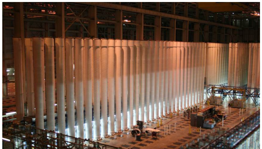
Gaszentrifugen sind klassische Dual-Use Güter: Sie können Uran zur zivilen wie auch militärischen Nutzung anreichern. USEC

Die Problematik des militärischen Missbrauchs von zivilen Nuklearprogrammen spiegelt sich auch im Streit um das irani-