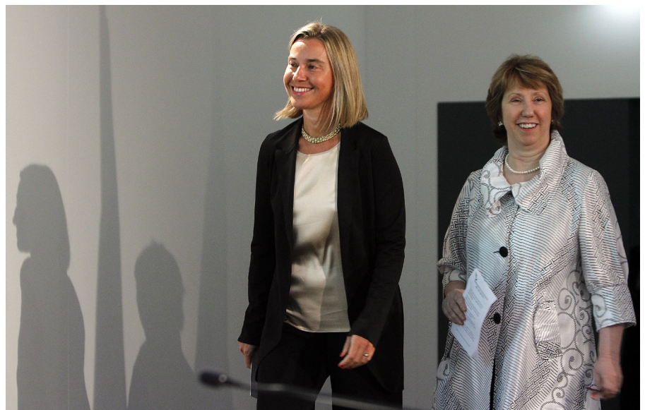
Am 30. August 2014 stellen sich Catherine Ashton (rechts) und ihre frisch gekürte Nachfolgerin Federica Mogherini am Ende des EU-Aussenministertreffens in Mailand den Fragen der Presse.

2010 musste Ashton zunächst viel Zeit und Energie darauf verwenden, den neuen Europäischen Auswärtigen Dienst (EAD) aufzubauen. Eine gemeinsame EU-Aussenpolitik wurde zudem im Sog der Fi-