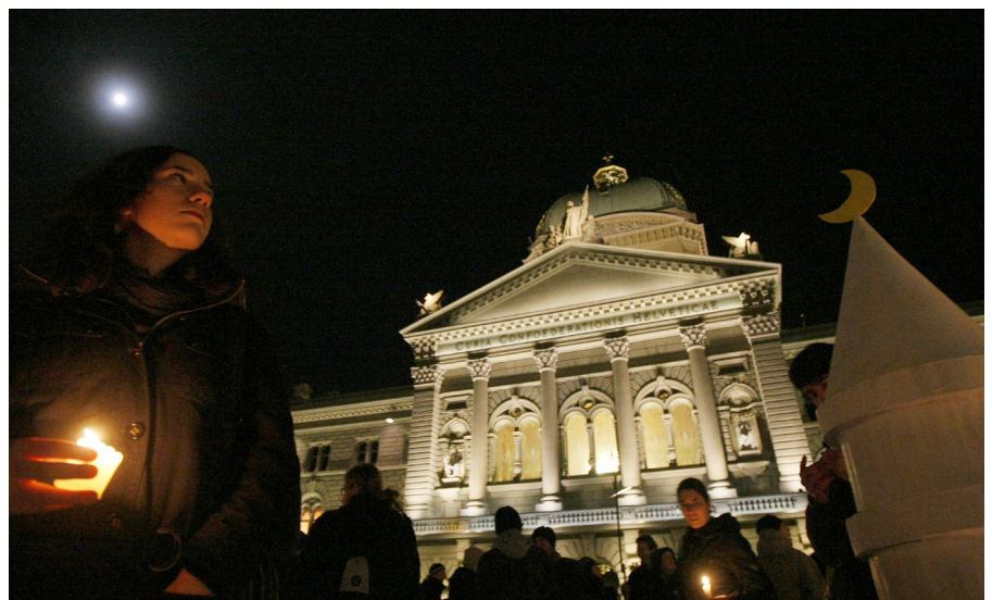
Des manifestants allument des bougies devant le Palais fédéral à Berne après que la Suisse a interdit la construction de minarets en 2009.

Quel impact la vague de terrorisme et le débat sur les mesures de lutte prises par les autorités ont-ils eu sur les attitudes à l'égard de l'islam et des musulmans en Suisse? Il s'agit d'une question pertinente quand on sait que, selon des études empiriques , la discrimination peut constituer un motif important de radicalisation djihadiste. Des enquêtes récentes révèlent des attitudes