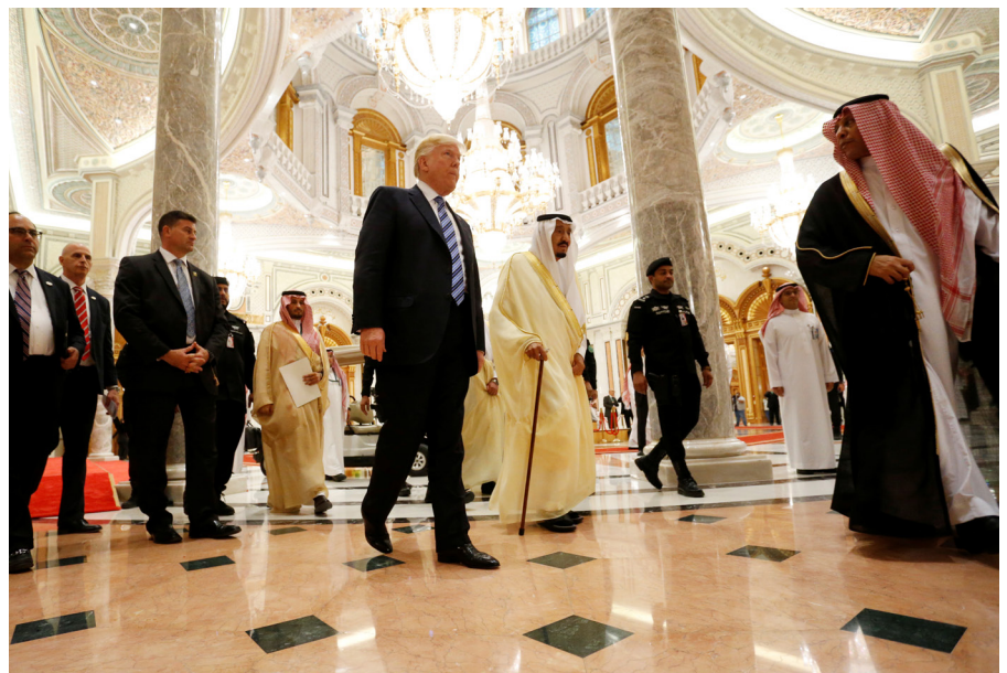
Le président américain Donald Trump et le roi Salman bin Abdulaziz Al Saud d'Arabie saoudite se rendent à Riyad, en Arabie saoudite (21 mai 2017).

Washington a recouru à un mélange d'engagement et de sanctions pour persuader l'Iran d'arrêter son programme d'armes nucléaires. Le pays a également joué un rôle de médiateur pour tenter d'instaurer la paix entre Israéliens et Palestiniens selon les grands principes soutenus par la communauté internationale – notamment une solution à deux États, une attitude flexible sur le statut de Jérusalem-Est et l'interruption de la colonisation israélienne dans les Territoires palestiniens. À la grande consternation d'alliés tels que l'Arabie saoudite, Obama a également encouragé les réformes démocratiques dans la région, bien que de façon incohérente et avec peu de succès, et évité de favoriser ouvertement un camp dans le clivage entre sunnites et chiïtes.