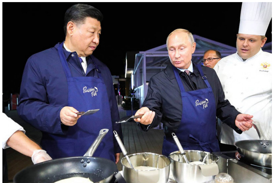
Wladimir Putin und Xi Jinping diskutierten ihre Zusammenarbeit und bereiteten russische Pfannkuchen zu am Eastern Economic Forum im September 2018 in Wladiwostok.

Mit ihrer «strategischen Partnerschaft» demonstrieren Putin und Xi Jinping mehr als symbolische Einigkeit. Der Handel zwischen den beiden Ländern hat in den letzten Jahren stark zugenommen. Die jeweiligen Volkswirtschaften scheinen komplementär: Russland liefert Energie und Rohstoffe und China exportiert Technologie, Industriegüter und Konsumwaren. Ausbaupotenzial besteht ferner im Bereich der Landwirtschaft und des Tourismus. Russische Landwirtschaftsprodukte treffen in China auf zunehmende Nachfrage und Russland ist zum beliebten Reiseziel chinesischer Touristen geworden. Nach lan-