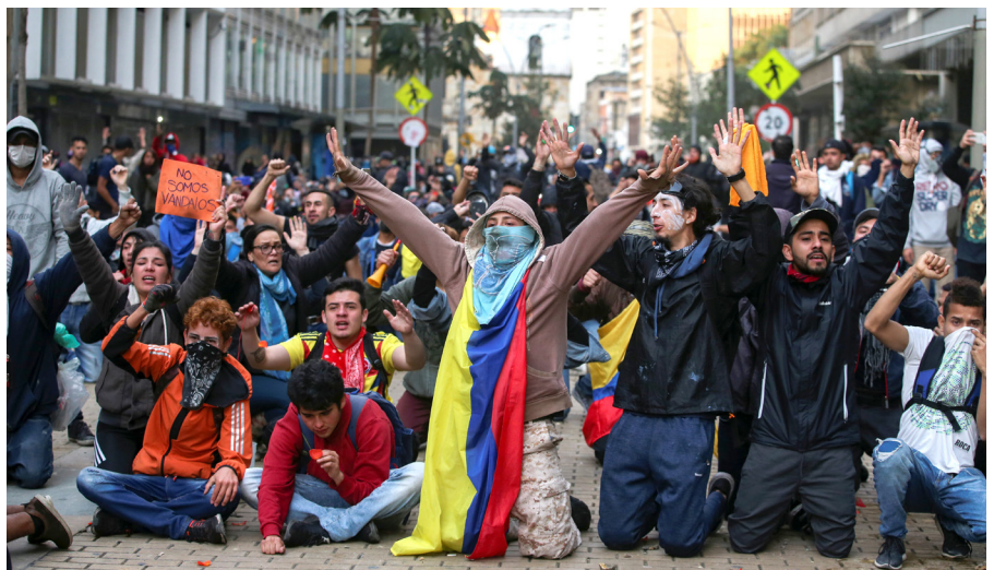
Demonstranten bringen während des Nationalstreiks im November 2019 ihre Unzufriedenheit mit der kolumbianischen Politik zum Ausdruck und fordern den Frieden.

Nach einer Reihe von Demobilisierungsprozessen mit bewaffneten Gruppen seit den 1990er Jahren, die wiederholt zu Teilfrieden führten, wurden grosse Hoffnungen in das Friedensabkommen gesetzt, welches die Regierung von Juan Manuel Santos im Jahr 2016 schliesslich mit der mächtigsten Guerillagruppe schloss. Nach einem harzigen Verhandlungsprozess in Havanna wurden die Revolutionären Streitkräfte Kolumbiens ( Fuerzas Armadas Revolucionarias de Colombia , FARC) zu einer legal anerkannten politischen Partei: die Alternative Revolutionäre Kraft des Volkes ( Fuerza Alternativa Revolucionaria del Común , weiterhin FARC). Mit dieser neuen politischen Plattform ist die FARC nun in der Lage, Ideen statt Waffen ins Feld zu führen. Dies hätte Kolumbien den lang ersehnten vollständigen Frieden bringen sollen.