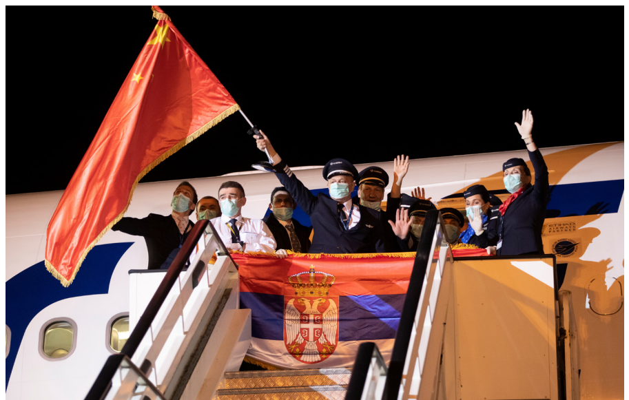
Membres de l'équipage fêtent l'arrivée d'experts médicaux et de fournitures médicales en provenance de Chine pour soutenir la Serbie dans la lutte contre le coronavirus.

Les Balkans occidentaux sont une région complexe, où de nombreux acteurs extérieurs cherchent à exercer leur influence en gagnant l'adhésion des différentes communautés ethniques et religieuses. L'Arabie saoudite et la Turquie entretiennent des liens avec les pays où l'islam prédomine (Albanie, Kosovo et Bosnie), par la diffusion du wahhabisme pour la première et la mise en avant de l'histoire et de la culture communes pour la seconde. Mais plus que l'influence de ces deux pays, ce sont surtout les liens de la Russie avec les groupes ethniques serbes orthodoxes et l'empreinte économique croissante de la Chine qui font obstacle à l'intégration de la région dans