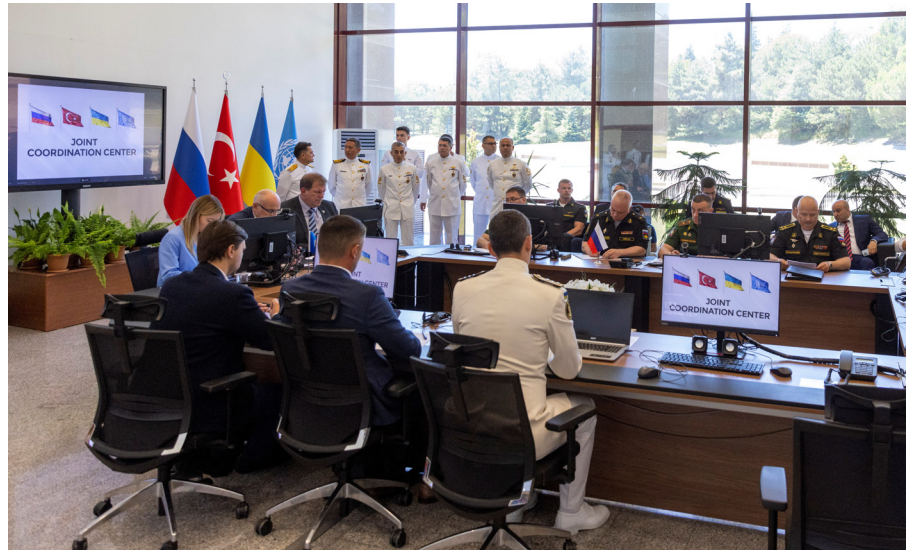
Rusya, Ukrayna, Türkiye ve BM’den delegeler 27 Temmuz 2022 tarihinde İstanbul’da Karadeniz Tahıl Anlaşmasını denetleyen ortak koordinasyon merkezinin (JCC) açılışına katıldılar.

Son on yılda Cumhurbaşkanı Recep Tayyip Erdoğan’ın hükümeti, dış politikadaki daha geniş düzen belirleyici hedeflerinin bir parçası olarak arabuluculuk fırsatlarını değerlendirmesini sağlayan siyasi girişimci bir anlayışı kurumsallaştırdı. Bu stratejik yaklaşım, ülkenin eşsiz coğrafyasını ve tarihini vurgulayarak Türkiye’nin uluslararası politikadaki “iki aradaki” siyasi konumundan yararlanmayı amaçlamaktadır. Bu söyleme dayanarak, Türk dış politika yapıcılarını Türkiye’yi Batı’ya alternatif olarak “güvenilir” bir arabulucu olarak sunmaktadır. Bu istisnacılık söylemi, Türkiye’nin uluslararası politikadaki arabuluculuk çabalarının temelini oluşturmaktadır. İstisnacılık söyle-